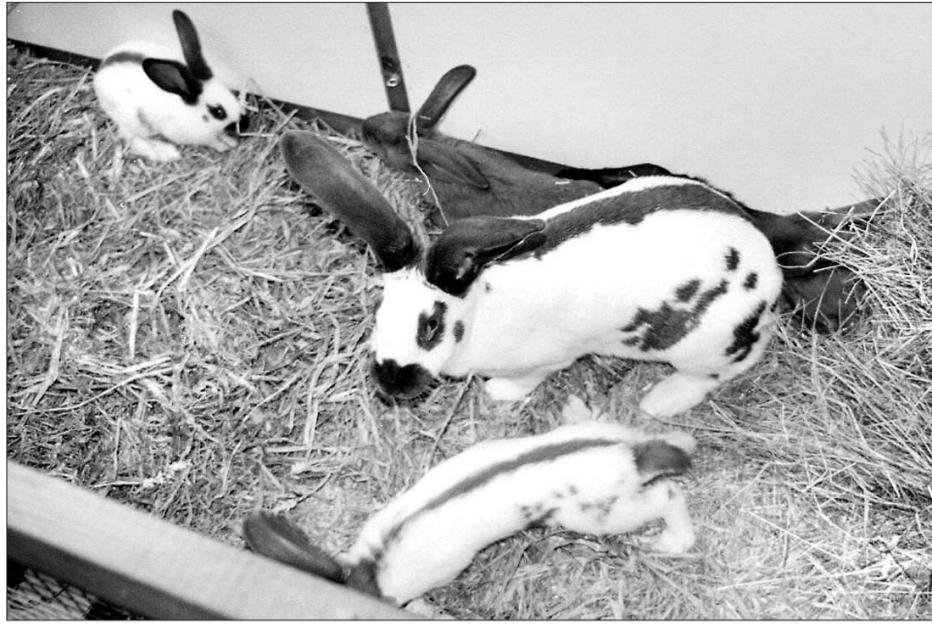
Kaninchen: Schweizer Schecken.

Auf diese Art lassen sich allein aus dem Raum Oberbaselbiet pro Jahr einige Tausend Kaninchenfelle zu sinnvollen Geschenkartikeln verwerten. Die Nähgruppe steht in einem engen Verhältnis zum Kleinvieh-zuchtverband beider Basel und daher liess sich die Jubiläumsfeier ideal mit einer Jungtierschau kombinieren. Ausgestellt waren Kaninchenfamilien aus der Region, dazu auch je ein Zwerg- und Sei-