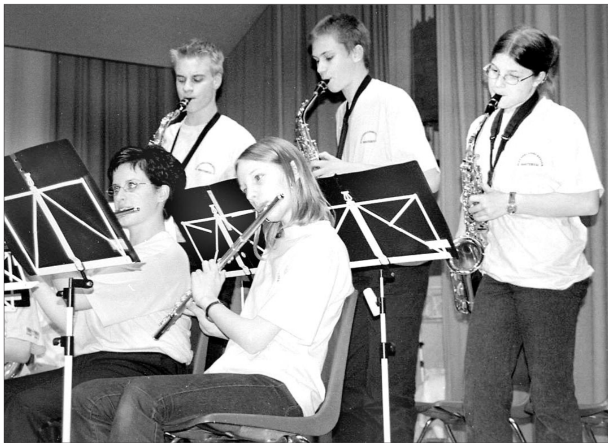
Einlage der Saxophongruppe der Jugendmusik Sissach/Diegtertal.