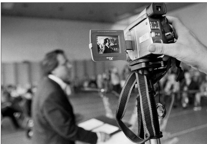
Wüthrichs Rede wurde auch gefilmt. Rund 60 Personen feierten den neuen Sissacher Regierungsrat.