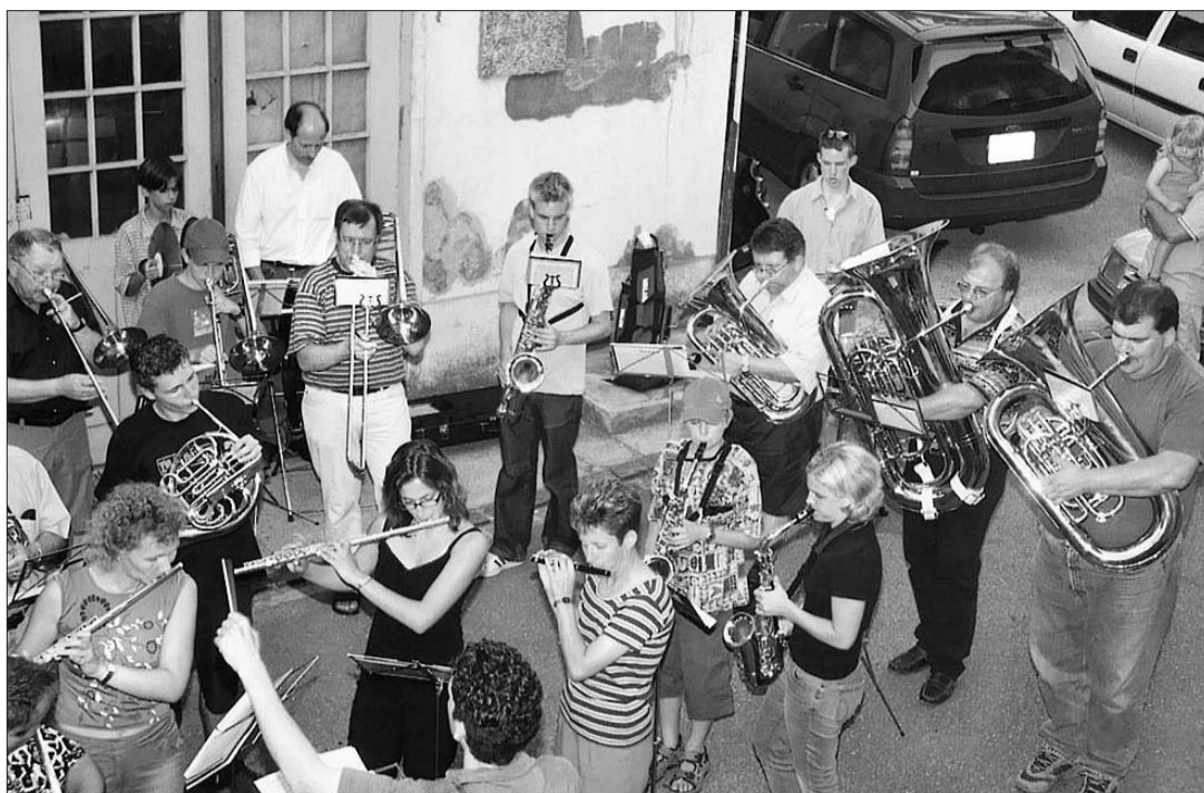
Der Musikverein spielt jeweils vier bis fünf Stücke – Apéro nicht inklusive.

Wenn es irgendwie geht, werden verschiedene Geburtstage zusammengelegt und die Jubilarinnen und Jubilare am