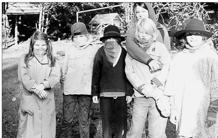
Eine Handvoll gefährlicher Räuber der Pfadi Farnsburg.

24 Kinder von der Pfadi Farnsburg verbrachten in Feldbrunn ein einwöchiges Lager. Erst wurden die Kinder in eine Benimmschule gesteckt, dann kriegten sie es mit einer Räuberbande zu tun.