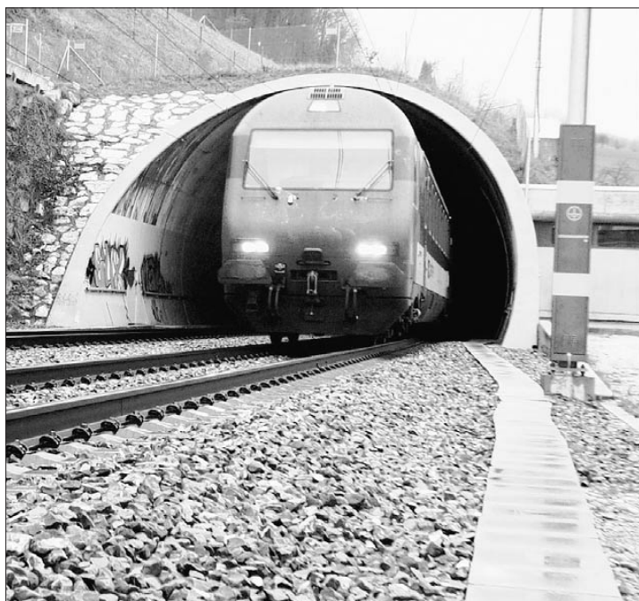
Soll mehr Verkehr auf die Schiene, muss die Kapazität erhöht werden – und dafür braucht den Wisenbergtunnel, ist der Verein für eine umweltgerechte Bahn, Itingen, überzeugt.

Ziel der Vereine ist immer noch der Bau des Wisenbergtunnels. Und dessen Bedeutung unterstrich Paul Kurrus, Baselbieter alt Nationalrat und Initiator des Komitees Pro Wisenberg. Die Mobilität nehme zu, sagte Kurrus, und das nicht nur in der Schweiz – im Individu-