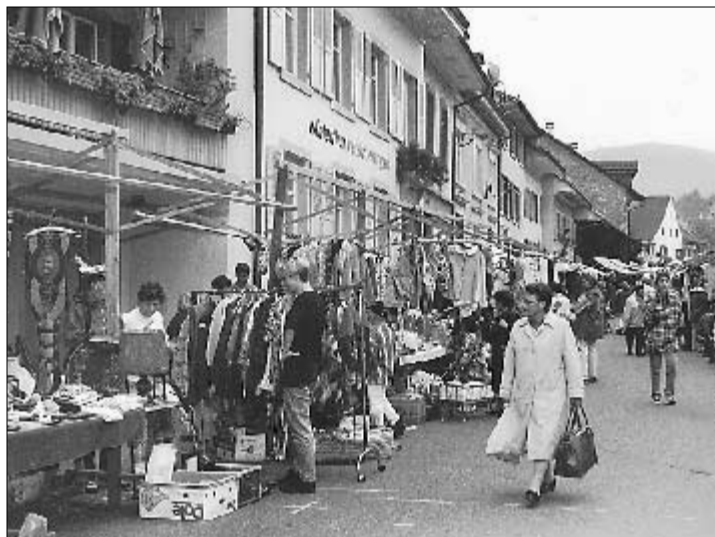
Wetterglück für den Gelterkinder Herbstmarkt.

Gestern fand im Dorfzentrum von Gelterkinden der traditionelle Herbstmarkt statt. Professionelle Marktfahrer und Amateure priesen an Ständen für jung und alt ihre Waren an.