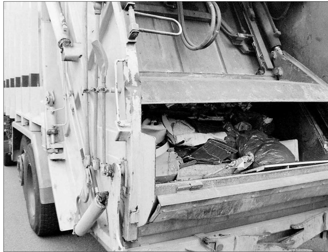
Mit der neu ins Spiel gebrachten Variante Eco-Press-System würde der wöchentliche, alles zermahlende Abfall-Lastwagen hinfällig.