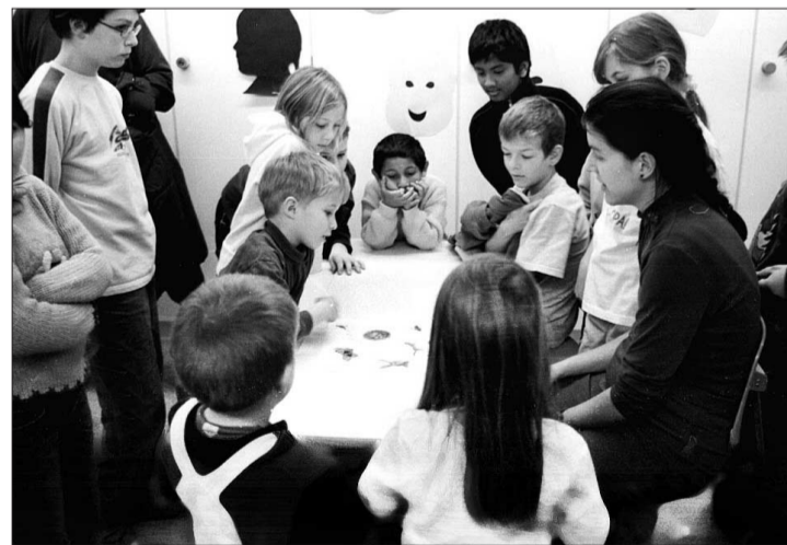
Eine ganze Woche malen und basteln statt Schulbank drücken hiess es für die Wintersinger Schüler.

Lesen, schreiben und rechnen gehören immer noch zu den Grundfächern der Primarschule, aber der Schulbetrieb ist abwechslungsreicher, vielfältiger und kreativer geworden.