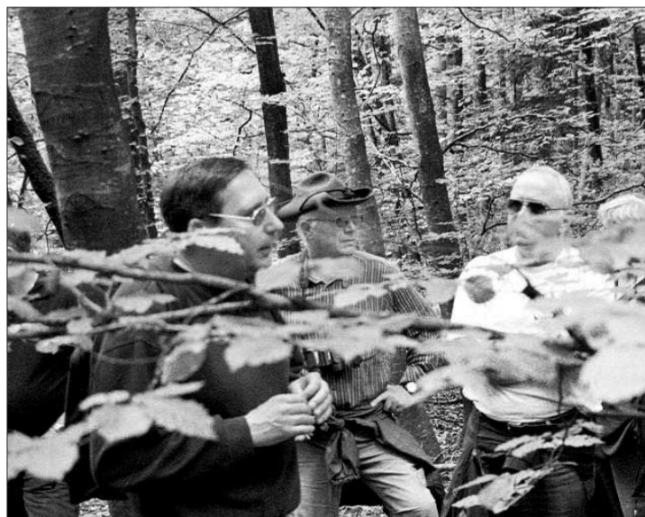
Wissenwertes über den Wald als Wasserspender, während des Waldgangs in Zunzgen.

So sicherte sich das Dorf einen Anteil von 15 Minutenlitern an der damaligen Bahnwasserversorgung, zu wenig, wie sich bald zeigen sollte. Darauf wollte die Gemeinde den Wasserbedarf mittels Abgraben einer