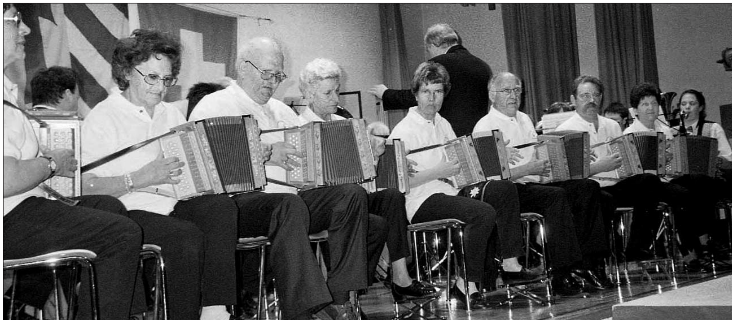
Rustikale Töne von der Schwyzerörgeli Grossformation «Tschoppelhof». Sie begeisterten das Publikum mit «Im Örgelihu».

Rund 180 Musikantinnen und Musikanten boten in der Tenniker Turnhalle ein breit gefächertes Programm, das von den Aktiven und ihren Dirigenten Höchstleistungen abverlangte.